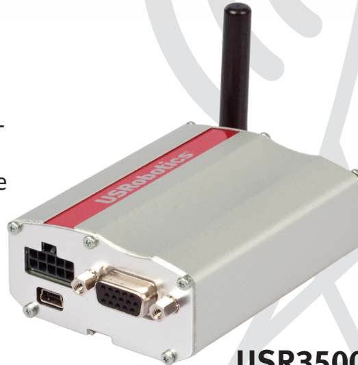
USR3500 Courier M2M 3G Cellular Modem