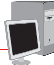
PC Serial Port