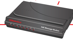
Model 5668D Message Modem