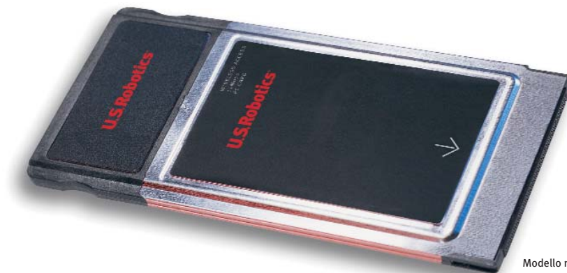
Modello n. 2410